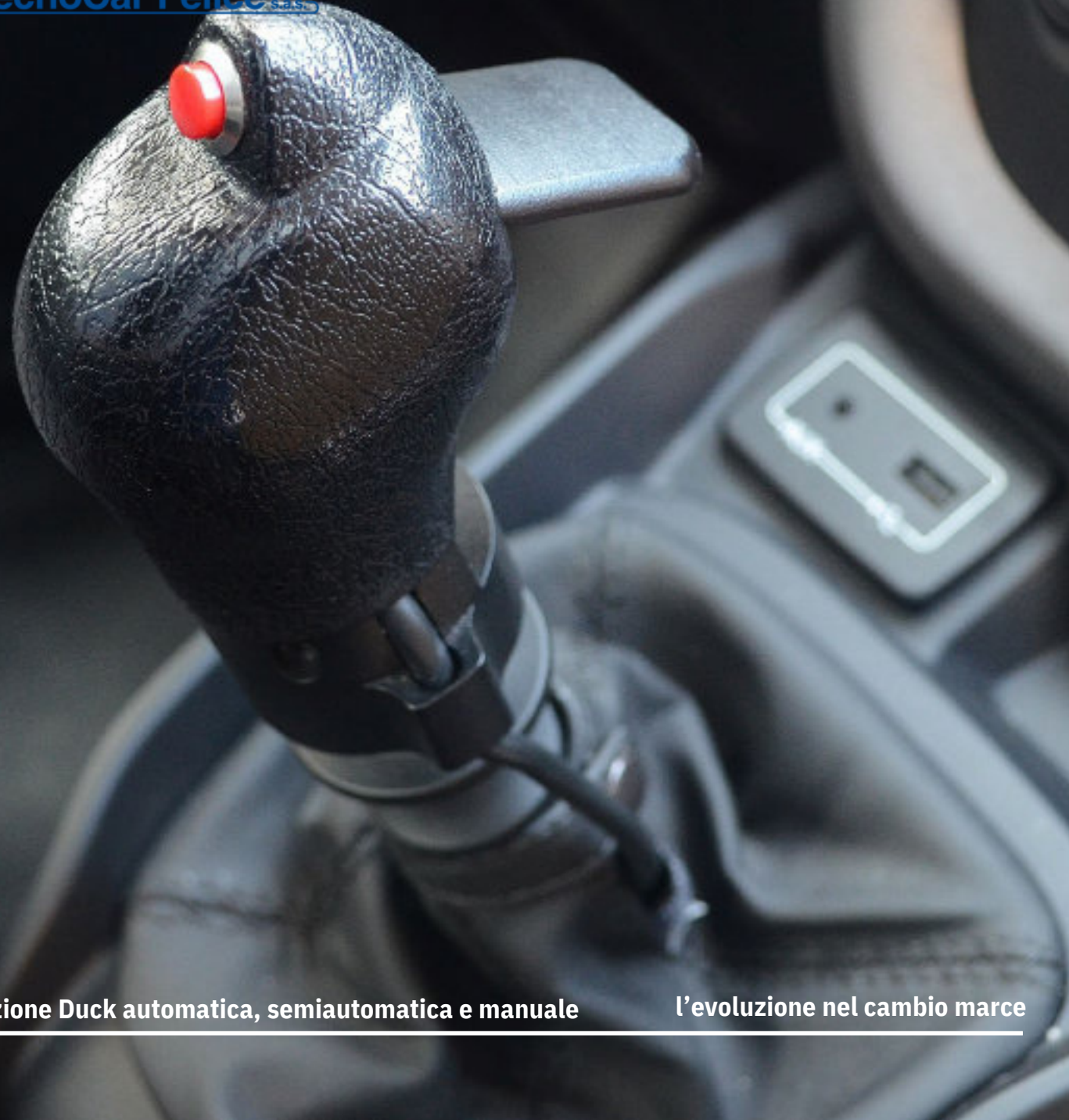
Frizione Duck automatica, semiautomatica e manuale